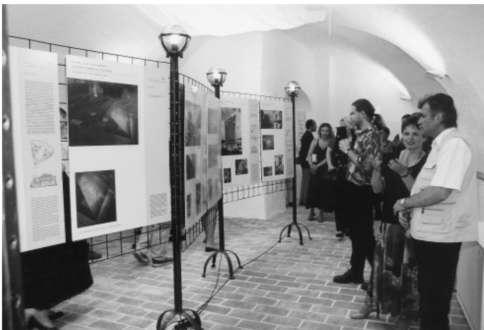
Interiér Městské galerie v Prelatuře

stavního kalendáře. Bližší podmínky je možné dohodnout přímo na odboru kultury MÚ. Obdobná výzva je určena i všem neziskovým organizacím ve městě, které by ve výše uvedených termínech měly zájem pořádat semináře či přednášky v prostorách nové galerie, ale i ostatním organizátorům kulturních akcí komorního charakteru. V případě zájmu jistě dojde k termínové shodě s budoucím výstavním kalendářem.