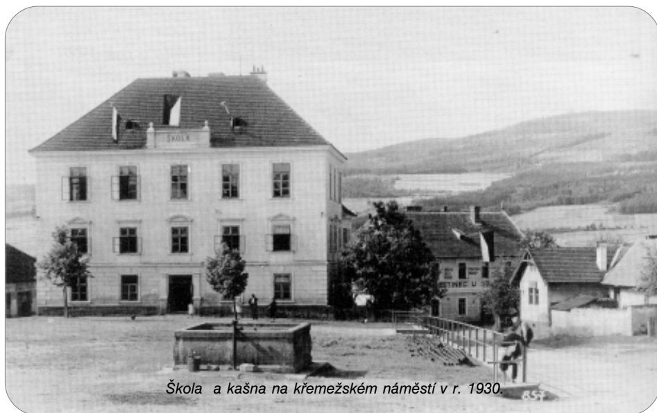
Škola a kašna na křemežském náměstí v r. 1930.

od 6 do 12 let, nemohla tato malá budova stačit. Byla proto zbořena a postavena v roce 1835 na náměstí škola nová. To už byl velký pokrok. „Povinná“ školní docházka se stále víc zpříšňovala a tak z jednotřídní obecné školy vznikla postupně škola trojtřídní v roce 1874 a v roce 1885 pětitřídní. To už chodilo do této obecné školy přes 500 žáků ze všech vesnic od Trísova až po Rojšín.