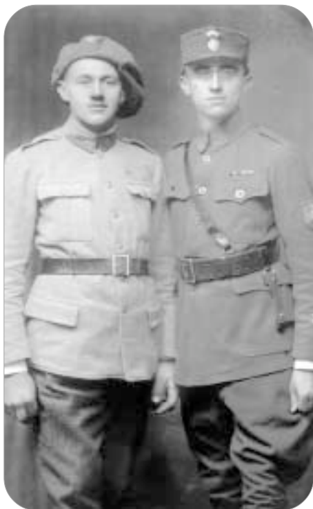
Italský a ruský legionář

ní obrany. Bylo velmi rozumné, že za první ČSR byly sestaveny seznamy legionářů podle míst narození. Z nich však mnozí odešli z Křemežska už jako mladí, další po válce za lepší životní existenci. Za své zásluhy měli totiž nárok dostat lepší umístění v práci nebo i státní službu. Tím se dávno na Křemežsku o nich už neví.