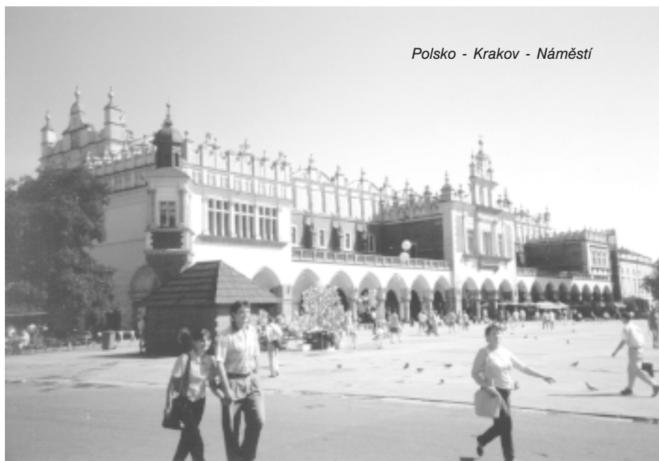
Polsko - Krakov - Náměstí

Krakow se chlubí i údajně největším náměstím ve střední Evropě. V jeho středu stojí Sukenice-známa tržnice, Radniční věž a kostel Sv. Vojtěcha. Asi každého návštěvníka překvapí hlas trubky, nesoucí se každou celou hodinu nad náměstím. Na svědomí ho má "živý" trubač, který troubí na památku svého předchůdce do čtyř světových stran. Troubení mělo varovat, podle legendy, obyvatele města před nepřátelským nájezdem a bylo utnuto ve chvíli, kdy se do trubačovy hrudi zabodl šíp. Dalším krakowským skvostem je kostel Mariacki, tyčící se naproti soše Adama Mickewicze. Malbami jej vyzdobil velký polský mistr Jan Matejko. V Krakově můžete ještě navštívit Židovskou čtvrť, nebo některou z mnoha galerií. Součástí jedné z nich je i světoznámý Leonardův obraz Dáma s hranostajem.