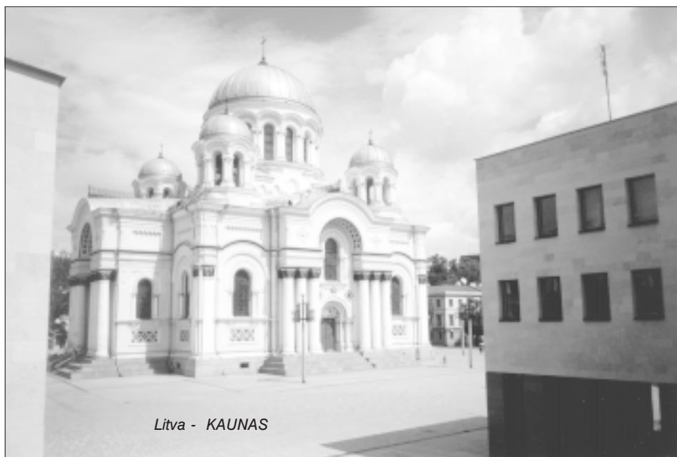
Litva - KAUNAS

Po kvalitní silnici kopírující mořské pobřeží projíždíme Lotyšskem. Naposledy se ještě navečeříme u moře (díky silnému větru se do moře odvažují jen ti nejotužilejší) a pokračujeme v přesunu směrem do Litvy. Na hranicích také nedělají problémy, takže ještě vpoledne můžeme zaparkovat u jedné litevské pum-