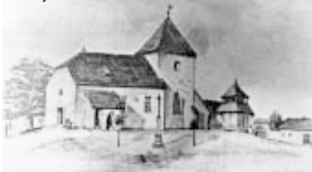
Starý kostel z roku 1557 stál do roku 1885