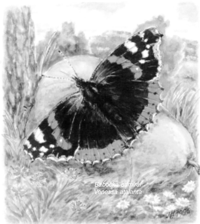
Babočka admirál Venessa atalanta

Největší rej motýlů na zahradě nastává v září, kdy dozrávají ranné hrušky a ryngle. To se slétají na spadlé plody babočky všech druhů, hodují na sladké šťávě a přeletují z jednoho druhu ovoce na druhý. Jak tomu bude letos si napíšeme v říjnovém čísle.