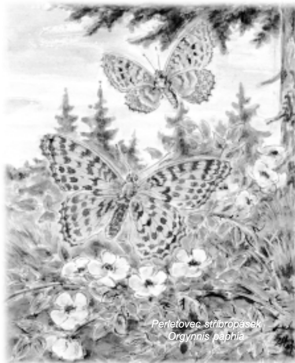
Perletovec stříbropásek Orgynnis baphia

Jedním z nejhezčích a také vzácnějších bělásků je u nás bělásek řeřichový, který má jen jarní formu a po červenci se v naší přírodě již téměř nevyskytuje. Samička je bílá s tma-