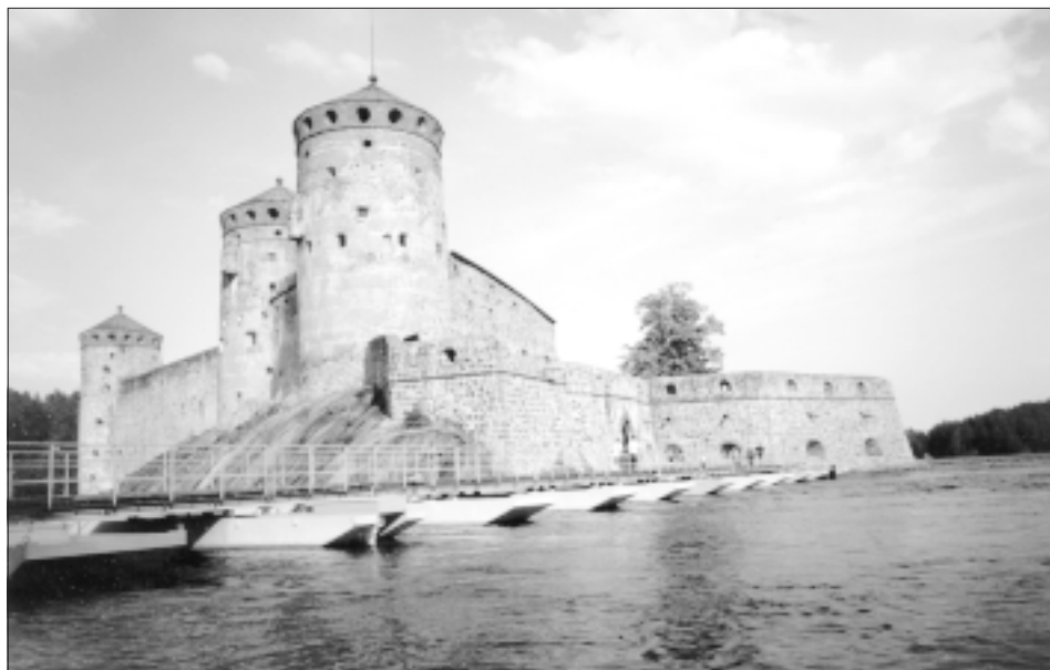
FINSKO - Savonlinna

U jednoho finského jezera si konečně vychutnáme i kouzlo "bílé noci". Ještě pozdě večer se koupeme v průzračně čisté a přitom krásně teplé vodě. Teplota vody mě osobně překvapila nejvíc. Vůbec jsem nedoufala, že se ve Finsku budeme koupat. Kolem půlnoci se sešeřilo a ve 2 hodiny se začalo opět rozednívat. Hodinky jsme se ve Finsku posunuli o hodinu zpět. Po noci, kdy jsme vychutnávali vymoženosti léta na severu, se samozřejmě dostavuje spánkový deficit. Ve městě MIKKELI nás snad i proto nejvíc zaujal žlutý pivní stan, který se od toho křemežského lišil pouze velkým bočním oknem. Uvnitř se konaly rybí hody a tak jsme drze přisedli a nasávali atmosféru. Při procházce městem zjišťujeme, že finština je pro nás zcela nesrozumitelným jazykem. Povědomé jsou nám pouze jména firem jako ASCO