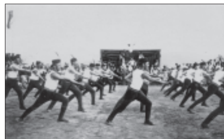
Nácvik mužů na prostrná v roce 1913

Šestý slet byl uspořádán v r. 1912 a probíhal současně jako slet Svazu slovanského Sokolstva a byl poslední před první světovou válkou. Sletové vystoupení byla rozšířena o Maratonský běh a antický pětiboj. Na letenské pláni vystoupilo 11.000 mužů, 5.600 žen a 8.000 dorostenců. Tribuny během sletu zaplnilo 170.000 diváků. Průvod tvořilo