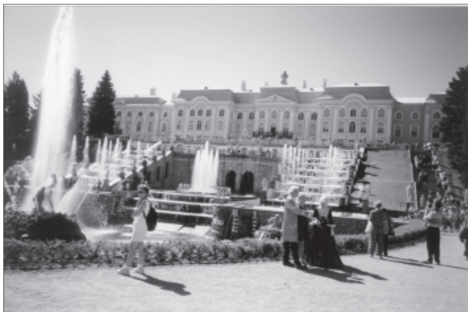
Rusko - Petrodvorec

Červencové slunce nám i nadále ukazuje svoji přízeň a tak vítáme program příštího dopoledne. Tím je návštěva letního sídla Petra Velikého na břehu Finského zálivu - Petrodvorců. Prostě den jako stvořený pro "guljanije po parku". Asi každého návštěvníka musí překvapit jeho rozlehlost a rozmanitost. Hned za vstupní bránou vás přivítají první fontány, kilometry živého plotu a stejně dokonale ostříhaných jehličnatých stromů. Vše je navrženo v typicky carsky velkorysém duchu. Od návštěvy paláce upouštíme hned při pohledu na nekonečnou frontu. Petrodvorec původně vznikl jako místo, odkud Petr Veliký dohlížel na stavbu námořní pevnosti na ostrově Kronštadt vzdáleném jen několik km od pobřeží.