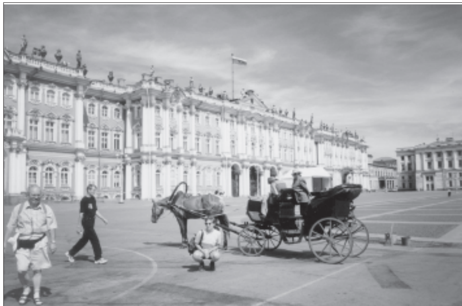
Rusko - Sankt Peterburg, náměstí před Zimním palácem

Nakonec se mu ale místo tak zalíbilo, že na něm nechal postupně postavit celou řadu paláců a okolní lesy nechal upravit do podoby parků. Hlavní atrakcí komplexu je Velká kaskáda - soustava fontán a kanálů postavená přímo za palácem. Více než 140 fontán je uspořádáno do různých geometrických obrazců a vodní proudy tak ve vzduchu vytvářejí roztodivné mlžné clony z rozprášené vody. Bílá barva vodní mlhy kontrastuje se zlatou barvou soch a vodních chrličů, které jsou součástí fontán. Další zajímavá fontána je opět vybudována ve stráni a tak má voda možnost téct po kaskádě dolů. Nahoře je velký zelený drak, z jehož chřtánu tryská voda. Naši pozornost upoutala i možnost převléknout se do kostýmu z 18. století a nechat se vyfotit třeba před fontánou. Ani se nedivíme, že se téměř nikdo v tom vedru do těžké róby nehrne. Procházku parkem zpříjemňuje místní kutálka světově osvědčenými hity. Po příjemně stráveném dopoledni se vracíme zpět do města. Tentokrát už nás nečekají rozpálené petrohradské ulice, ale snad nám milosrdný stín poskytne budova