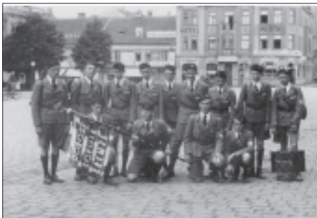
Odjezd dorostenců Sokola Křemže na X. všesokolský slet v Praze 1938

venského národa proti expanzivnímu nacismu. Prostná mužů byla zakončena zpěvem chorálu a přísahou Sokolů republiky.