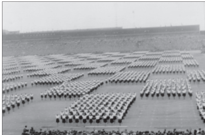
Nástup žen na Strahově XI. všesokolský slet v Praze 1948

- Podklady článku čerpal z novinových výstřižků a z památníku Tělocvičné jednoty Sokola v Křemži Z. Hořejší -