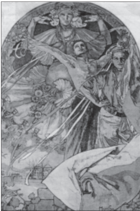
Návrh Alfonse Muchy na pohlednici k VIII. všesokolskému sletu 1926. Slety nebyly jen vystoupením Sokolů, ale i výtvarníků, hudebníků - autorů hudby pro prostná mužů, žen i dorostu. To byla vlastně manifestace celého národa za svobodu, řád a demokracii.

venského národa proti expanzivnímu nacismu. Prostná mužů byla zakončena zpěvem chorálu a přísahou Sokolů republiky.