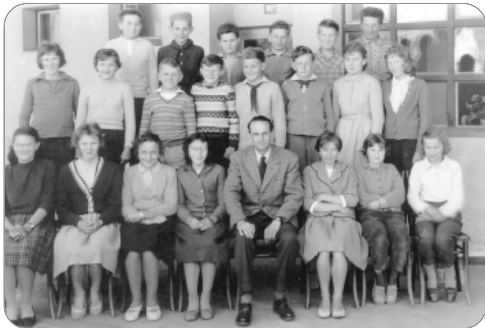
Jako třídní učitel s třídou 7. A v roce 1962.

přání. Proto na působení svého třídního učitele ve Křemži jeho žáci stále s vděčností a láskou vzpomínají.