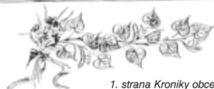
1. strana Kroniky obce Křemže - IV. díl