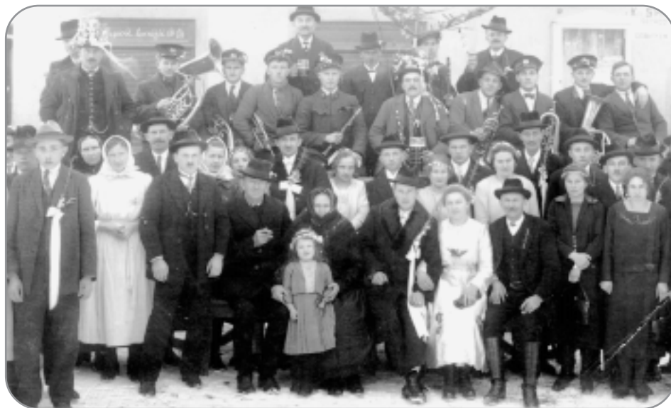
Svatba z ledna 1926

Svátkem Tří králů končí vždy doba vánoční a začíná veselá doba masopustní, která trvá až do Popeleční středy. Byla to doba bálů (plesů) a také doba svateb. Málokdy se odbyvaly svatby v ostatních ročních obdobích a nikdy ne v máji, protože lidová tradice věřila, že manželství uzavřené v tomto měsíci je nešťastné. Říkalo se "V máji na máry". Církev nesouhlasila se svatebním ve-