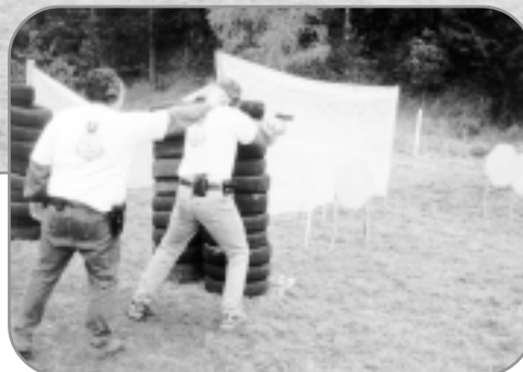
„Přepadení finančního úřadu“