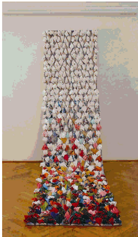
Z výstavy Věry Boudníkové

Přihlášky Muzejního kruhu jsou k dispozici v pokladnách muzea nebo je zájemcům zasíláme.