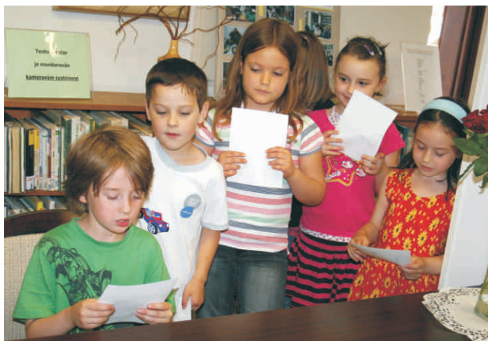
Žáci z 1. třídy ZŠ Linecká.