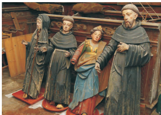
Dotace umožní zrekonstruovat jednotlivé objekty kláštera i jejich interiér.