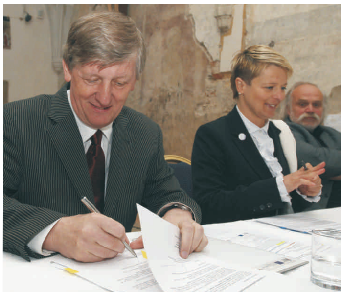
Ministr kultury Václav Riedelbauch podepisuje dopis o poskytnutí dotace.

„Hlavním cílem projektu je rehabilitovat v současnosti nevyužívaný a z větší části uzavřený areál klášterů. S tím je spojeno ekonomicky udržitelné celoroční poskytování kulturních služeb odborné i laické veřejnosti,“ vysvětlil smysl projektu jeho koordinátor Jan Vondrouš. V prostorách kláštera budou prezentovány moderní formy uchování a prezentace kulturního dědictví spojeného s historií areálu a celého města. To by mělo přilákat obyvatele Českého Krumlova do historického centra. Dalším cílem je vytvořit modelový příklad využití obdobných historických areálů pro oživení městských center.