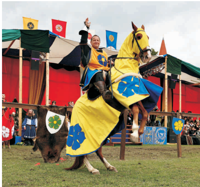
Rytířská scéna bude i letos v pivovarské zahradě.

„Po loňských velkolepých oslavách 700. výročí města Český Krumlov a prezentaci průřezu několika historickými epochami Českého Krumlova se v letošním roce vracíme zpátky k renesanci a posledním Rožmberkům. I přestože oslavy významného jubilea města Český Krumlov jsou za námi, program bude také velmi bohatý a pestrý. Z hlavních bodů letošního již 24. ročníku bych zmínil například historický kostýmovaný průvod městem, v němž bude nesené několik originálních