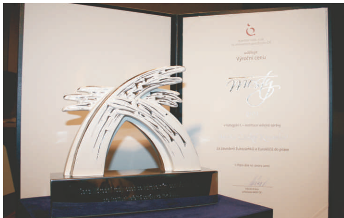
Cena Mosty akademické sochařky J. Wernerové.

Město Český Krumlov nakoupilo euroklíče pro zdravotně postižené občany v srpnu 2009. Do nákupu 100 ks speciálních standardizovaných klíčů investovalo necelých 40 tisíc Kč. Euroklíče jsou na Odboru sociálních věcí a zdravotnictví Městského úřadu Český Krumlov na