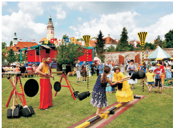
Rytířské hry během Slavností pětিলisté růže.

V předvečer renesančních oslav otevře Regionální muzeum v Českém Krumlově po téměř dvouleté rekonstrukci opět své brány s vernisáží výstavy Příběh města Český Krumlov. K vidění budou desítky exponátů v obou patrech nově zrekonstruovaného muzea. Součástí exponátů bude také originál listiny Jindřicha I. z Rožmberka z roku 1309, v níž je Český Krumlov poprvé označen za město. Pořadatelé výstavy jsou Regionální muzeum v Českém Krumlově, Jihočeské muzeum v Českých Budějovicích, Státní okresní archiv Český Krumlov, Státní oblastní archiv v Třeboni oddělení Český Krumlov a město Český Krumlov.