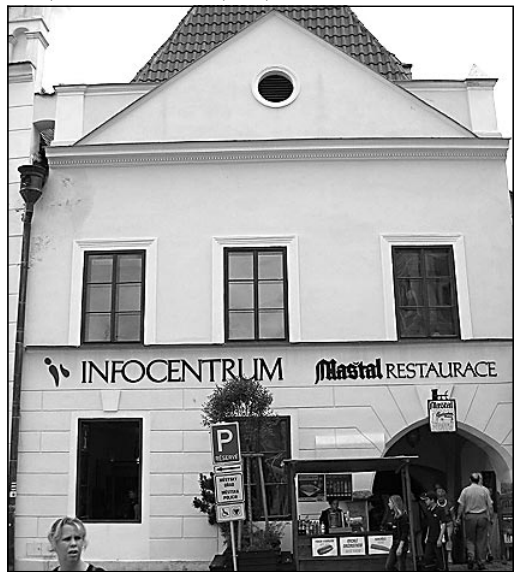
Dnes je v domě Infocentrum, ubytování i restaurace.

I jeho původ, stejně jako u všech domů na