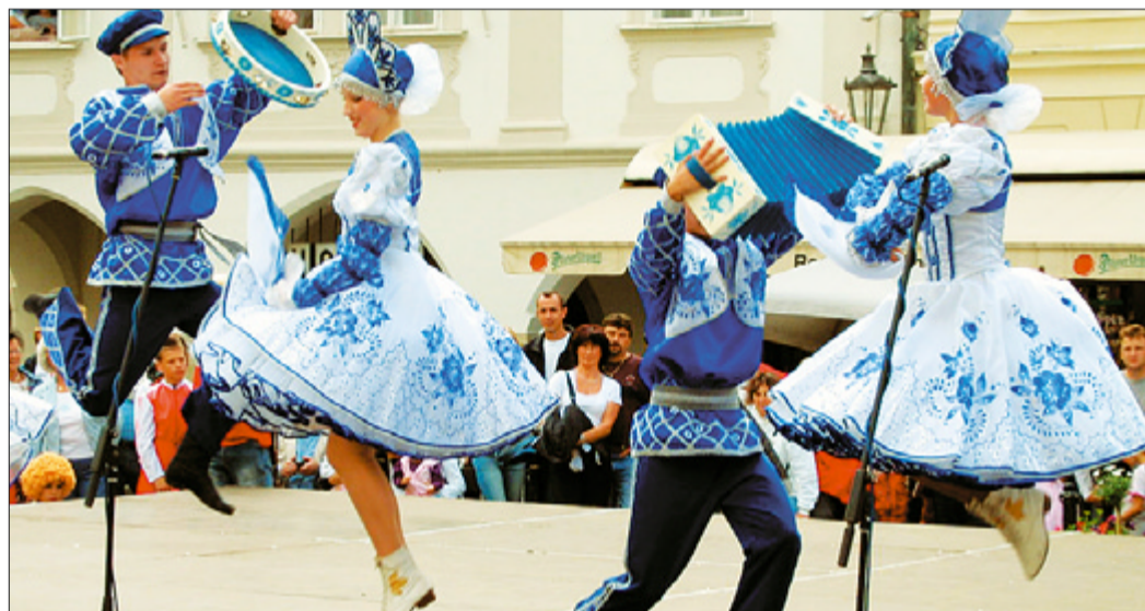
Minulou sobotu se na náměstí Svornosti konalo jedno ze čtyř vystoupení 180 dětí z uměleckých souborů z Ruska, Ukrajiny, Tatarstanu a dalších zemí v rámci Mezinárodního hudebního festivalu dětí a mládeže v Jihočeském kraji. Četní diváci obdivovali i tento soubor z Jekatěrínburku.

Pravidla pro vydávání povolení k vjezdu vozidel do pěší zóny, tedy příloha č. 6 vyhlášky, nově stanoví, že v jednorázovém povolení musí být vyznačeno místo opravy nebo číslo popisné objektu, kde oprava probíhá, a předpokládaná doba opravy (začátek a konec opravy).