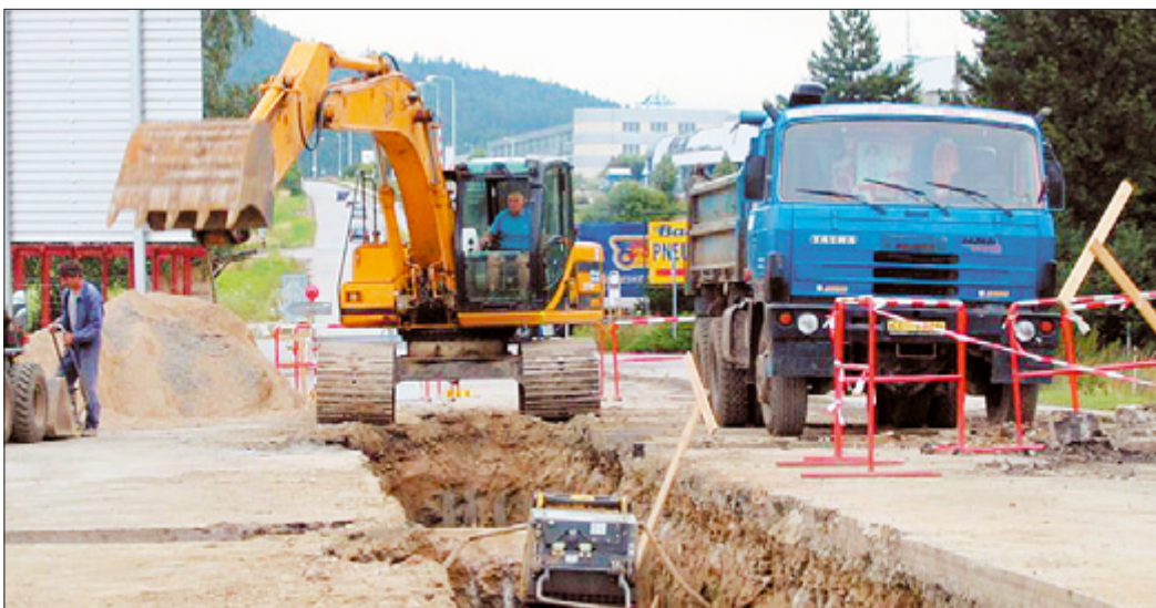
Práce u ústí Tovární ulice u kruhového objezdu by měly být hotovy do dvou týdnů - a objížďka po okraji sídliště Mír tím skončí.

Novinkou krumlovské turistické sezóny jsou historické trhy, které se uskuteční na náměstí Svornosti dnes a zítra. Ve 20 stáncích nabídnou hlavně řemeslní výrobci vlastní zboží, které nelze koupit v českokrumlovských obchodech - různé druhy užitné keramiky, sklo, malované romantické hodiny, vyšívání ubrusy, lněné tašky, předměty ze soustruženého dřeva, látkové hračky, kožené výrobky, šperky z kovu, části rytířské zbroje apod. Ani klobásky nebudou chybět. Občané mohou nakupovat a místní podnikatelé okukovat, jaké zboží je žádané a mohlo by obohatit i jejich provozovny, oba dny od 9 do 19 h. Trhy tohoto charakteru znají dnešní Krumlovští pouze ze slavností. Pro obohacení a zpestření nabídky akcí ve městě pro místní občany i návštěvníky jsou další historické trhy naplánovány na konec prázdnin - 2. a 3. září.